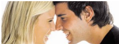
Privates Glück ist auch mit Partnervermittlern nicht garantiert.

Liebe ist nicht käuflich, heißt es. Teuer ist sie trotzdem manchmal. Das musste auch ein damals 75-jähriger am eigenen Leib erfahren. Er suchte die Richtige – und bekam eine Rechnung über 7200 Euro. Der Pensionist hatte 2012 eine Partnervermittlerin damit beauftragt, ihn zwölf Monate lang zu betreuen und ihm in diesem Zeitraum mindestens sechs Vorschläge für mögliche Partnerinnen zu übermitteln. Dafür bezahlte er 7200 Euro bei Vertragsabschluss. Laut Anforderungsprofil sollte das Höchstalter der Frauen bei 72 Jahren liegen, wobei der Mann angab, 30 bis 40 Jahre jüngere Frauen zu bevorzugen. Diese Vorgabe hat die Auftraggeberin allerdings als unrealistisch abgetan und nicht ernst genommen. In weiterer Folge habe sie ins-